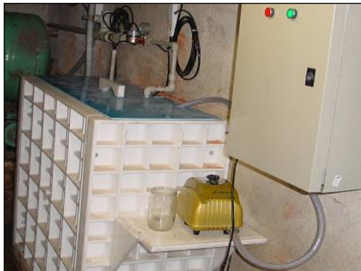
Tab.1: Podtlaková membránová filtrace – úprava pitné vody